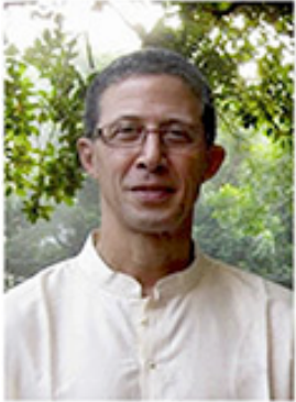
Sr. Tim Boyd Presidente de la Sociedad Teosófica Internacional desde el 24 de abril de 2014

¿Qué es diferente para el buscador espiritual? La diferencia no está en los problemas mismos, sino en la actitud de la mente al abordarlos. Existe un aforismo en la sabiduría convencional que nos dice “conocimiento es poder”. Para aquellos que están conscientemente comprometidos en un proceso de autotransformación existe una jerarquía de percepción en la cual el conocimiento normal es el primer paso. El desenvolvimiento de la conciencia se mueve desde el conocimiento, al entendimiento, a la sabiduría. La necesidad actual para la mayoría de nosotros es movernos más allá de la información, reuniendo las tendencias de la mente hasta las funciones más profundas de una mente iluminada por buddhi. Solo esta mente refleja la amplitud, la creatividad, la comprensión, la libertad y la compasión que caracterizan la vida inspirada. La información ofrece la estructura y es un proceso mental. La comprensión es una función de la intuición espiritual, buddhi.